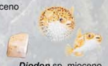
Diodon sp. mioceno