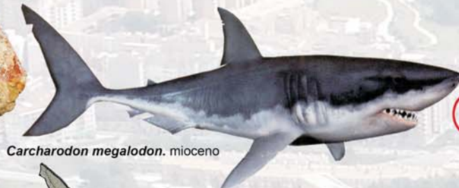
Carcharodon megalodon . mioceno