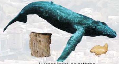
Huesos indet. de cetáceo