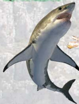
Cretoxyrhina sp. cretácico