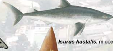
Isurus hastalis . mioceno