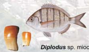
Diplodus sp. mioceno