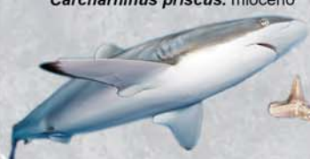
Carcharhinus priscus . mioceno