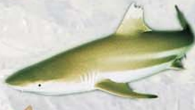
Carcharinus egertoni . oligoceno