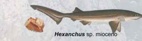
Hexanchus sp. mioceno