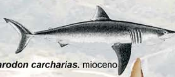
Carcharodon carcharias . mioceno