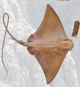
Mylobatis sp. mioceno