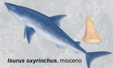
Isurus oxyrinchus . mioceno