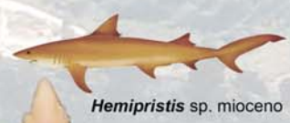
Hemipristis sp. mioceno