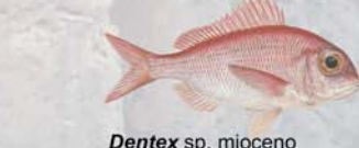
Dentex sp. mioceno