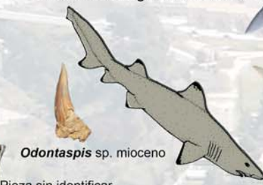
Odontaspis sp. mioceno