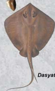
Dasyatis sp. mioceno