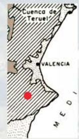
• ÁREA DE ALCOY