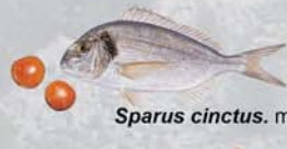
Sparus cinctus . mioceno