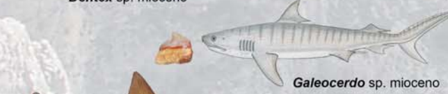
Galeocerdo sp. mioceno